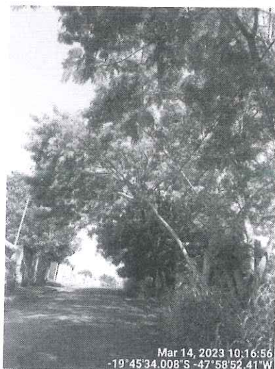
Figura 1 – Vista dos espécimes a serem podados.